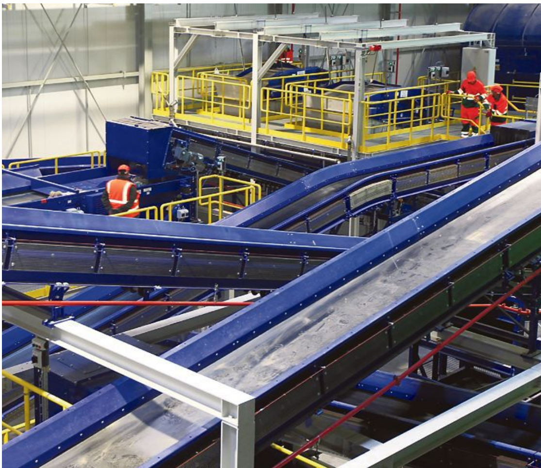
Regijski center za ravnanje z odpadki bo mestno blagajno obogatil za 64 milijonov evrov.

Druga postavka, ki se opazno znižuje, so transferni prihodki, kjer se zbirajo sredstva za projekte, sofinancirane z evropskim in državnim denarjem. Namesto 83,2 milijona evrov na občini pričakujejo, da jih bodo zbrali 72,4 milijona. Kljub znižanju bo to rekordno leto, kar je pričakovano, saj se iztekajo