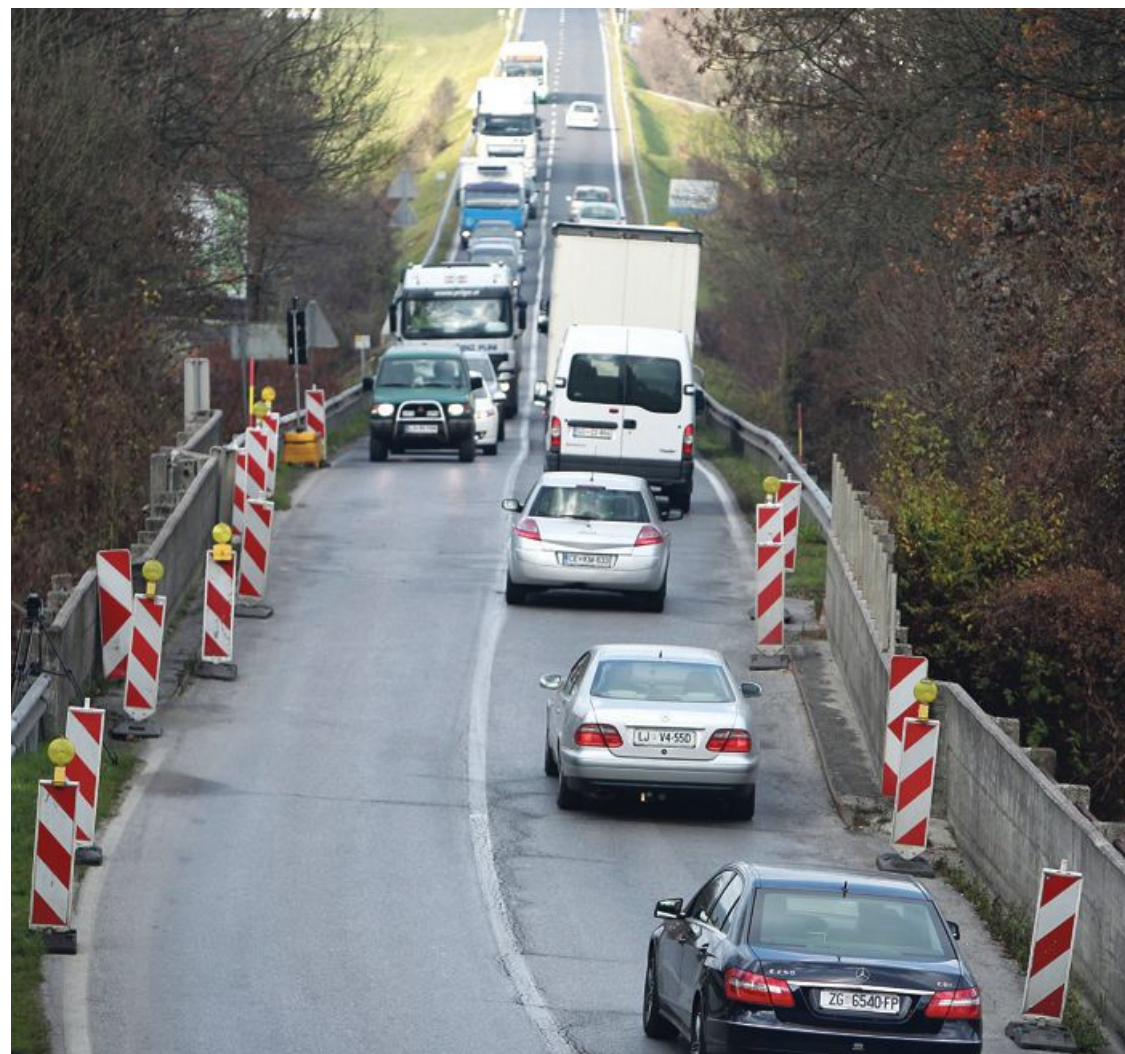
Denarja za obnovo nadvoza je dovolj, a kaj, ko se izbira izvajalca vleče v nedogled.

Društvo, pod okriljem katerega je hiša hospica delovala pet let, upravljavec pa je bil mestni stanovaljski sklad, je občini plačevalo najemnino, ki je znašala 2803 evrov na mesec, vendar je oddstelo manj, 2544 evrov, ker so skladna najemno pogodbo tako poročunavali vplačani vložek, s katerim je društvo sofinanciralo gradnjo hiše. Kot je povedala Robanova, bodo dobili povrnjeno razliko za gradnjo, z opremo pa se še dogovarjajo. Poleg tega poudarja, da je Slovensko društvo hospic še naprej na voljo vsem, ki ga potrebujejo, pri čemer so storitve za uporabnike brezplačne.